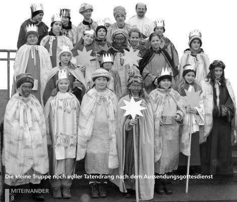
Die kleine Truppe noch voller Tatendrang nach dem Aussendungsgottesdienst