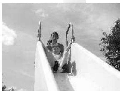
Spaß im Schwimmbad