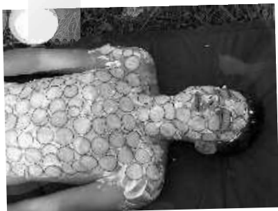
Unsere kleine Schönheits- farm

Mehr Fotos vom Zeltlager gibt's im Internet: