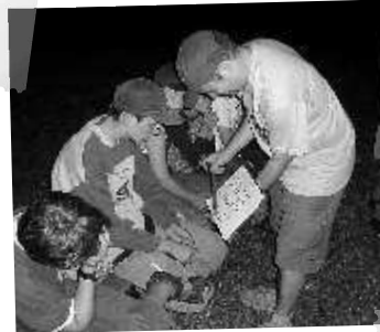
»Eignungstest« für Zeitreisende