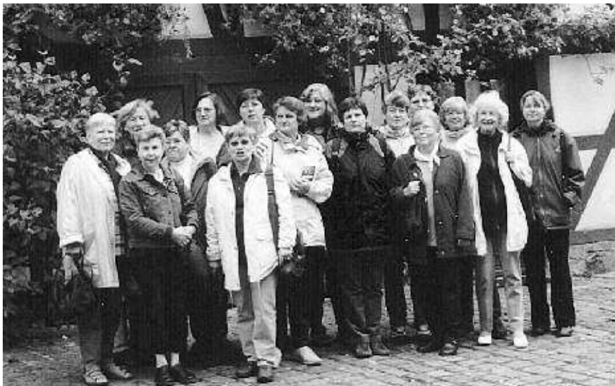
In der Lohrer Fischergasse nahm sich der Frauenkreis Zeit für ein Gruppenfoto

Genaue Informationen finden Sie jeweils auf der Gottesdienstordnung. Wir freuen uns immer über Gäste oder neue Mitglieder.