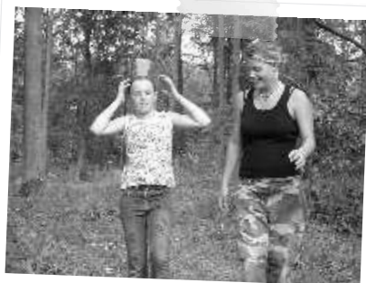
Wasser(trau)sport in Ägypten