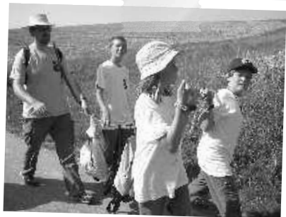
Gepäck- transport bei der Wanderung