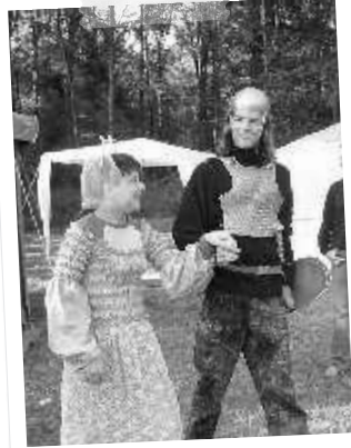
Die Prinzessin und der tapfere Ritter

Das Gras war noch grün, der Himmel blau, doch das klingt uns alles viel zu schlaui. Drum schicken wir 'n paar Kinder her, die machen Zeltlager schöner sehr. Die Sonne schien uns ins Gesicht, drum schreiben wir euch ein Gedicht. Ausgebildet wurden wir, um durch die Zeit zu reisen hier. Am Samstag dann beim ersten Spiel, mussten wir Korke sammeln viel um in den verschiedenen Epochen zu landen, mussten wir diese in Energie umwandeln. Am Sonntag durften wir schlafen lange und uns war dabei gar nicht bange, den wir mussten geh'n von Station zu Station und am Abend kam der Pfarrer mit seiner Mission. Am Montag machten die Leiter mit uns Scheiß, denn wir wanderten nur im Kreis! Im Schwimmbad dann ins Wasser gesprungen, waren die Sorgen alle verklungen. Im Gegensatz zum letzten Jahr die Zweitageswanderung ein Luxus war. Sie war so schnell vorbei, ehe man konnte zählen bis drei. Am Dienstag waren die Workshops dran, da gingen alle ganz schön ran. Didgeridoo, Sand-Karten und Pizzen ließen uns alle ganz arg schwitzen. Mr. und Mrs. Lager machte allen Spaß, das letzte Spiel, das war's. Am Lagerfeuer wurde viel gesungen und mit Überfällern stark gerungen. Das Massieren war unser Lieblingssport, Gottseidank passierte dabei kein Mord. Das Essen, das war auch sehr fein, doch aßen alle wie ein Schwein. Viele Freundschaften wurden geschlossen, und nur sehr wenige Tränen vergossen. Und die Moral von dem Gedicht, Zeltlager vergisst man einfach nicht.