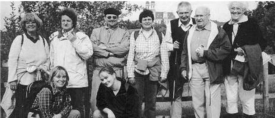
Ein Teil der Wandergruppe erklimm den Ellwanger Schlossberg und genoss den Blick zurück auf das Kloster Schöneberg