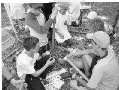
Hier werden Didgeridoo's gebaut