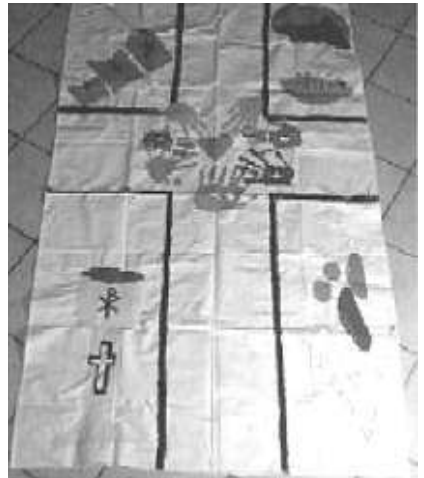
Das von den KonfirmandInnen selbst gestaltete Abendmahlstuch