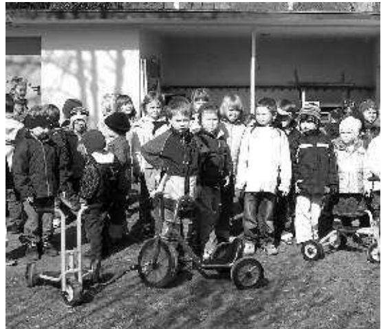
Die Kinder freuen sich über die neuen Roller

Falls Sie uns und unsere Arbeit ein Stück näher kennen lernen wollen, besuchen Sie doch unsere Aufführung am Sommerfest um 14.00 Uhr. Wir freuen uns auf Sie!