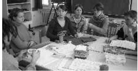
Beim Turmbau aus Papier ging es ganz nebenbei um das Rollenverhalten in einer Gruppe

praktische Inhalte für die Gruppenstunde nicht zu kurz und es konnten jede Menge Spiele und Methoden selbst ausprobiert werden. M. Goldbach