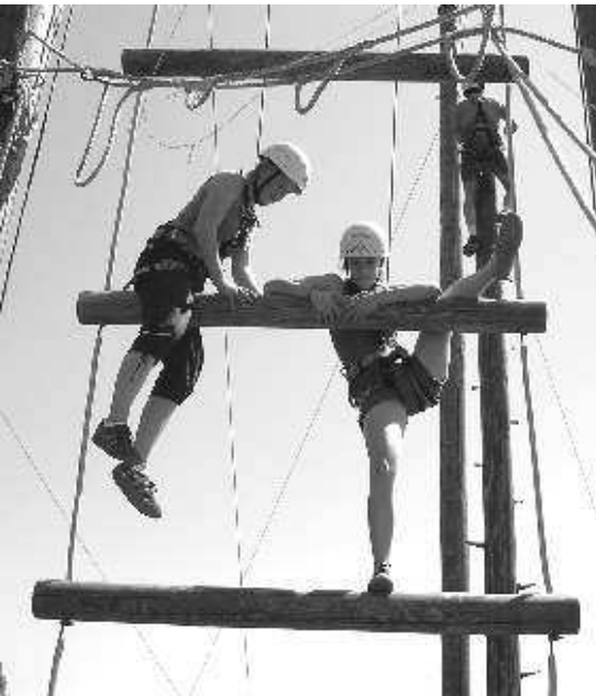
Gemeinsamer Aufstieg in luftige Höhen auf der übergroßen Strickleiter

Mehr »Fräuleins« im Internet: www.Die-Fraeuleins.de