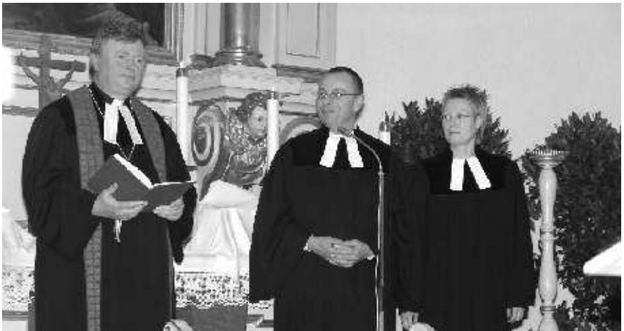
Der Evangelische Regionalbischof Helmut Völkel bei der Einführung des Pfarrer-Ehepaars Jülich