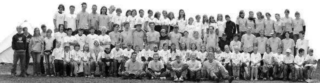
Gruppenfoto mit den Zeltlagerteilnehmern 2005