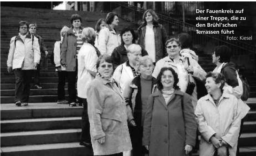
Der Fauenkreis auf einer Treppe, die zu den Brühl'schen Terrassen führt