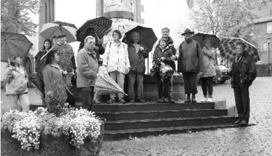
Beim Rundgang durch Steinau waren Schirme der Beste Schutz gegen Dauerregen

Der Weg führte dann durch die Stadt mit ihren schönen alten Fachwerkhäusern, vorbei an weiteren historischen Bauwerken, hin zum Brüder-Grimm-Haus, dem alten, ebenfalls im 16. Jahrhundert entstandenen Amtshaus. Hier wohnten Jakob und Wilhelm mit ihren Eltern und Geschwistern.