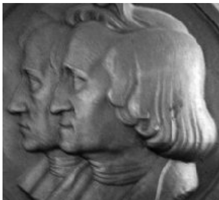
◀ Relief der Gebrüder Grimm am Schloss Steinau