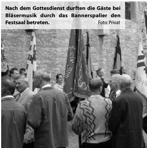
Nach dem Gottesdienst durften die Gäste bei Bläsermusik durch das Bannerspalier den Festsaal betreten.

Als selbstbewusste, politische Gemeinschaft haben wir die Wirrnisse des dritten Reiches überstanden und politische Persönlichkeiten in unseren Reihen gehabt, die christliches Engagement in ihr politisches Wirken haben einfließen lassen.