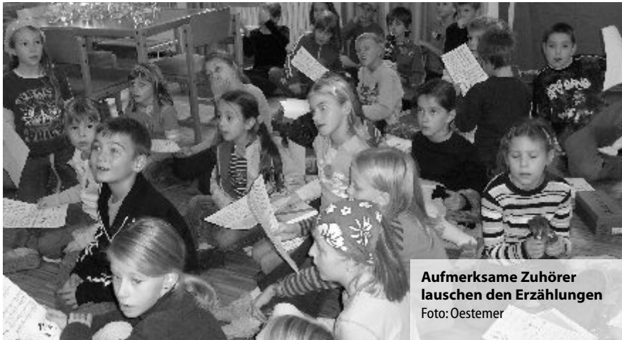
Aufmerksame Zuhörer lauschen den Erzählungen