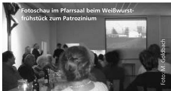
Fotoschau im Pfarrsaal beim Weißwurstfrühstück zum Patrozinium