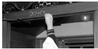
Kinder in den Gewändern

der Heiligen Drei Könige Kaspar, Melchior und Balthasar in unserer Pfarrei von Haus zu Haus. Mit dem Segen brachten die Sternsinger eine weitere Botschaft: Kindern ist der Erhalt und Schutz der Schöpfung wichtig, überall auf der Welt. Am Beispielland Madagaskar machten sie dies deutlich. Im Rahmen des Gottesdienstes, den die Sternsinger mitgestalteten, wurden diese Gedanken in Gebet, Lied und Katechese zur Sprache gebracht. Am Ende der Feier wurden die Kinder „ausgesandt“.