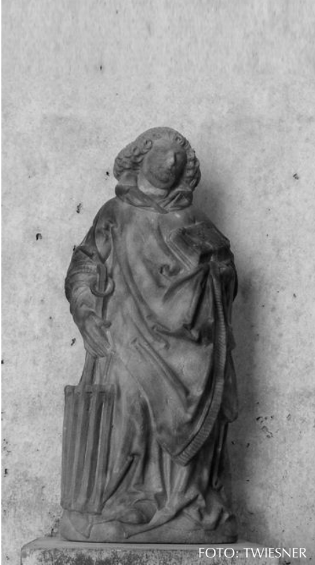
Hl. Laurentius aus der Ölberg-Kapelle