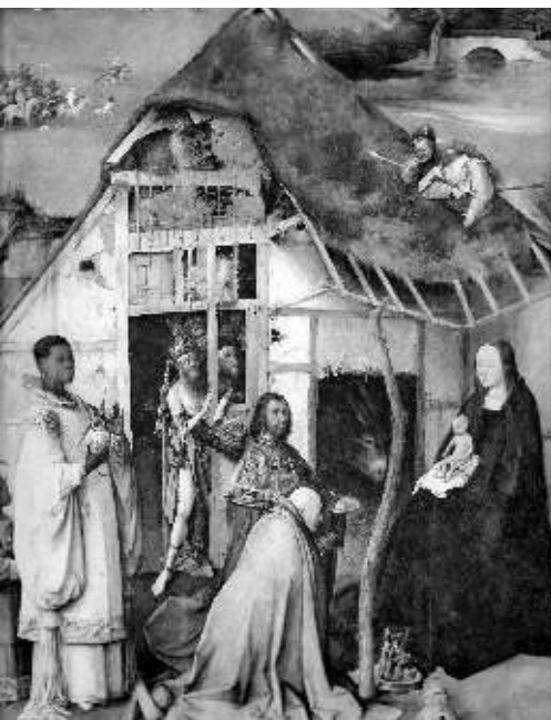
Das Bild links ist ein Detail aus dem Epiphanie-Tryptichon von Hieronymus Bosch, das »die Anbetung der Heiligen Drei Könige« zeigt. Das Bild ist um 1510 entstanden und heute im Museo del Prado in Madrid im Original zu sehen.