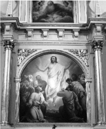
EULOGIUS BÖHLER SCHUF DAS ZWEITEILIGE ALTARBILD »DIE HIMMELFAHRT CHRISTI« IN DER EVANGELISCHEN KIRCHE SANKT PAUL IN HEIDINGSFELD.

Wenn die Kinder so fragen, dann fragen sie als Kinder unserer Zeit. Wie wir selbst sind sie geprägt von jenem Wahrheitsbegriff, den das naturwissenschaftliche Denken der Moderne hervorgebracht hat. Wahr ist nach diesem Verständnis das Faktische, das, was wir messen und geschichtlich datieren können, was wir mit unseren Sinnen wahrnehmen und mit der Kamera einfangen können. Und darum tun wir uns schwer mit Erzählungen wie der Himmelfahrtsgeschichte. Denn deren Wahrheit liegt auf einer anderen Ebene. Wenn wir sie lesen wie einen Zeitungsbericht, dann werden wir ihr nicht gerecht. Lukas* war kein Reporter. Sein Ziel ist nicht die Dokumentation, sondern die Verkündigung. Und