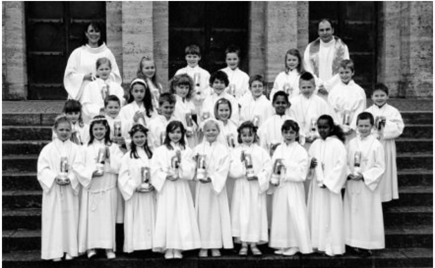
ERSTKOMMUNION 2008 Das Bild vom Weizenkorn stand im Mittelpunkt der Gottesdienste zur Erstkommunion in Sankt Laurentius (oben) und Zur Heiligen Familie (unten). In der Heiligen Familie machten die Kinder durch ein Anspiel deutlich, was für eine große Kraft in diesem winzigen unscheinbaren Korn steckt. Sie zeigten, wie sich das Weizenkorn entfaltet und zu einer prächtigen Ähre heranwächst. In St. Laurentius säten die Kinder vor der Kommunion Weizenkörner in die Erde und brachten im Gottesdienst die kleinen Töpfchen mit grünen Halmen zum Altar.