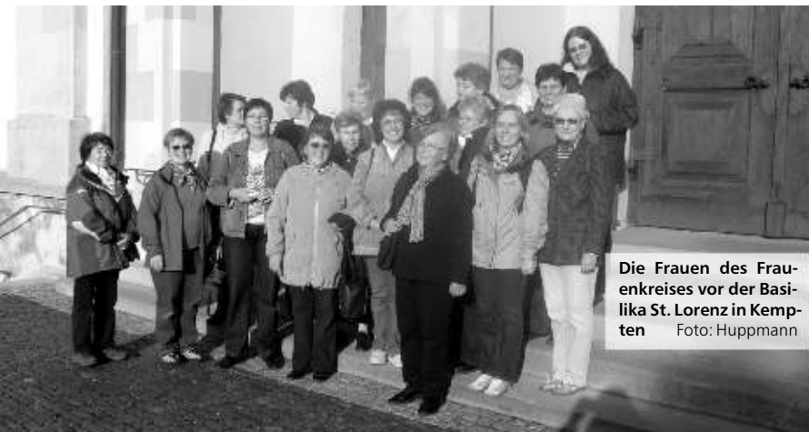
Die Frauen des Frauenkreises vor der Basilika St. Lorenz in Kempten