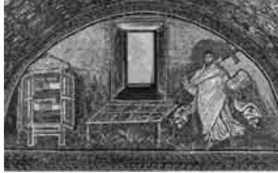
Mosaik, Anfang 5. Jh., Ravenna, Mausoleum der Galla Placidia: Älteste Darstellung des Laurentius mit Rost