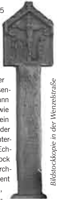
Bildstockkopie in der Wenzelstraße

Manfred Morys kommt das Verdienst zu, mit seiner Doktorarbeit aus dem Jahre 1958 eine eindrucksvolle Beschreibung der Rechtspflege und Rechtsgeschichte des „alten Heidingsfelds“ erstellt zu haben. Hier wird der rechtsgeschichtliche Hintergrund des Sühnebildstocks wissenschaftlich fundiert erläutert. Schon vor 1367 hatte Heidingsfeld die „Hohe Gerichtsbarkeit“ oder das Recht zum „Halsgericht“ d.h. im heutigen Sprachgebrauch, eine zuständige Instanz für Strafprozesse einschließlich der Befugnis, die Höchststrafe (= Todesstrafe) auszusprechen. Es wurden daher wohl auch Galgen im Bereich des Kirchbergs errichtet, laut Dokumentenlage jedoch wohl kaum genutzt. Ab 1583 ging die Zuständigkeit an fürstbischöfliche Stellen in Würzburg