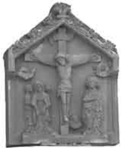
Kapitell des Sühnebildstocks

über. Nachweisen lässt sich in Heidingsfeld vor allem das im 15. Jahrhundert beliebte Rechtsinstitut des Sühneverfahrens: Die „Teydigung“ oder „Taidung“, bei welchem der Täter einem fünfköpfigen Gremium anstelle des „Halsgerichts“ überantwortet wurde. Der Täter musste für sein Opfer als sog. „Seelgerät“ einen Sühnebildstock setzen, zwanzig Pfund Wachs stiften und drei Wallfahrten unternehmen; zudem musste er den unmündigen Kindern seines Opfers Unterhaltsgeld bezahlen und einen Bürgen hierfür stellen. Ein relativ „modern“ erscheinendes Rechtsinstitut mit eher zivilrechtlichem Blickwinkel (Schadensersatz/Unterhalt) – echtes „bürgerliches Recht“ sozusagen.