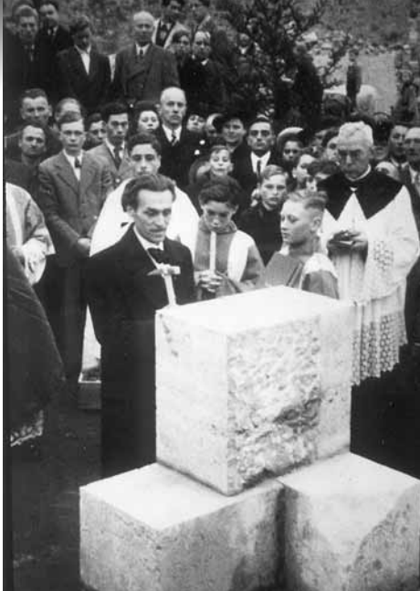
Grundsteinlegung der Laurentiuskirche Oktober 1928

Aufruf an die Pfarrfamilie, soweit sie sich aus allen vier Winden nach der Zerstreuung wieder in den Ruinen zusammengefunden hatte, sich am kommenden Montag auf den Ruinen der Kirche einzufinden, um die Trümmer zu beseitigen und den Platz herzurichten für den Wiederaufbau. Es war ein unmöglich erscheinendes Beginnen. 100 Schaufeln und 15 Pickel hat das Wirtschaftsamt genehmigt als einziges Werkzeug. In einem einzigartigen, opferwilligen Einsatz haben die Frauen und Kinder, alt und jung, die Geistlichen der Pfarrei und die Klosterfrauen der Armen Schulschwestern und der Barmherzigen Schwestern in wochenlangem Einsatz mitgeholfen, die über 6000 cbm umfassenden Ruinen und Schuttmassen abzutragen und zu beseitigen und das verwertbare Material zu lagern. Nach Dienstschluß kamen dann die wenigen Männer, die aus dem Krieg, der Gefangenschaft und Krankheit übriggeblieben waren, und