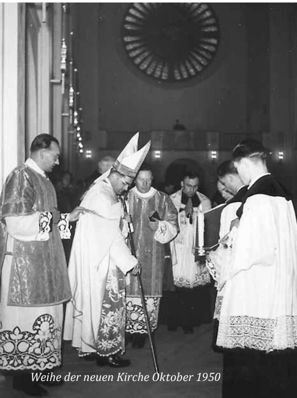
Weihe der neuen Kirche Oktober 1950