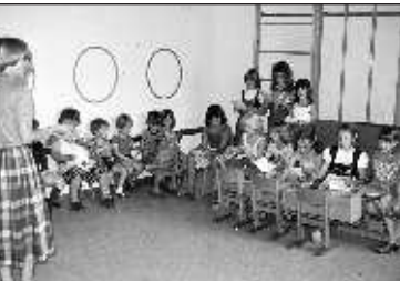
Musikprobe im Kindergarten für den Familiengottesdienst im Juli 1979

Gleich zwei Seiten der A4-großen Ausgabe sind den Familien- und Kindergottesdienstangeboten gewidmet. Eingeladen wurde zu den Familiengottesdiensten am Vorabend des Erntedankfests, zu Sankt Martin und am ersten Adventssonntag. Vom Familiengottesdienst im Juli 1979 sind schließlich noch einige Fotos abgedruckt.