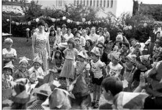
Fischangeln, Büchsenlaufen, Traktorrennen und mehr stand auf dem Programm beim Kindergartenfest am 14. Juli 1979 auf den Wiesen rund um den Kindergarten. Die Kinder waren mit Begeisterung dabei

Angekündigt wird die Aufstellung eines neuen Ambos und neuer Priestersitze, die wie zuvor schon der »Lebensbaum« von Max Walter entworfen wurden. Zur Freude des Pfarrers hat die Kosten hierfür die Diözese übernommen. ◀