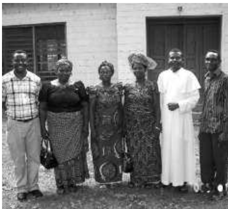
Gruppenbild der Frauen des Frauenkreises aus Sheri/Nigeria (linkes Bild)

In einem Brief vom 22. Mai 2009 bedankten sich die Frauen sehr herzlich. Sie sind voll Hoffnung auf einen großen Erfolg und versprochen, uns regelmäßig über die Entwicklung des Projekts zu informieren. E. Huppmann | A. Kiesel