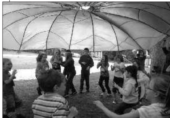
Der Fallschirm als „Kurzzeit-Zelt“: Spaß beim Spielen am Nachmittag des Kinderbibeltags.

Doch was wäre ein Kinderbibeltag ohne die herrliche Mittagspause! Jugendliche der Heiligen Familie hatten für uns gekocht (ein ganz herzliches Dankeschön an euch!), danach lud der Sonnenschein zum Spielen im Freien ein. Ein rundum gelungener Tag, der nicht nur den Kindern, sondern auch dem Vorbereitungsteam viel Freude gemacht hat. G. ERNST