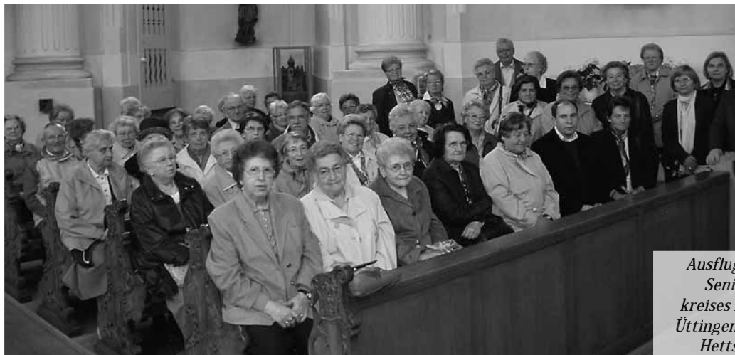
Ausflug des Senioren- kreises nach Üttingen und Hettstadt