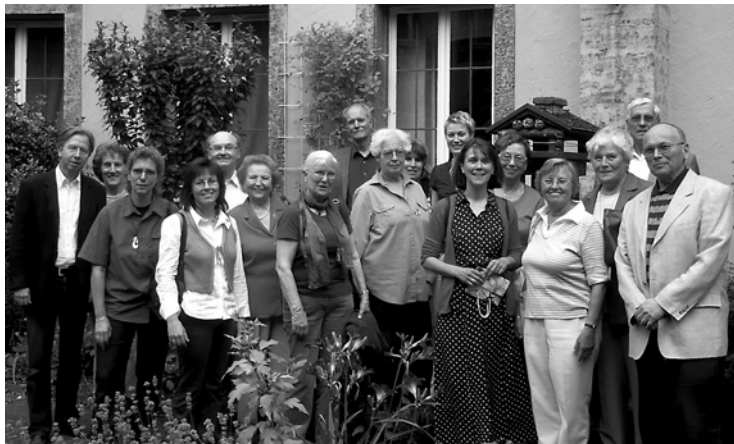
Beim Besuch der griech.-orth. Kapelle in der Martinstraße.