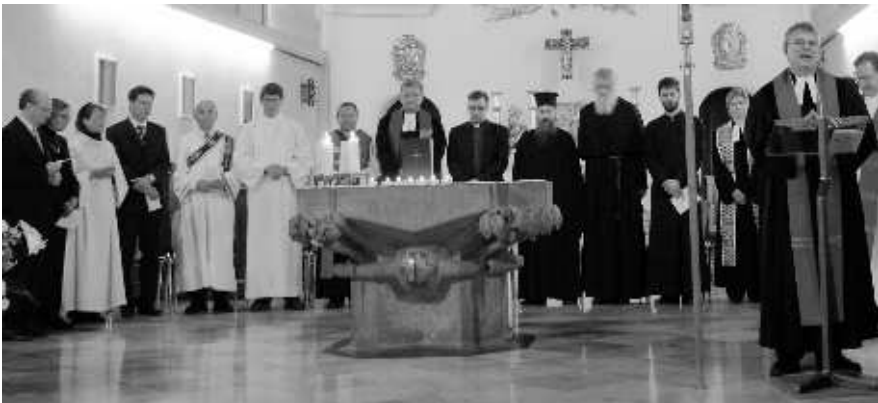
Während des Gottesdienstes in der Augustinerkirche