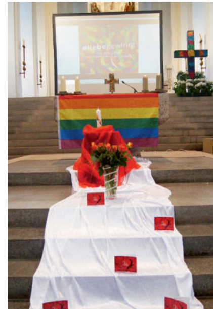
Klaus Hösterey, Pfr.

der Liebe als Bereicherung und Segen empfinden.