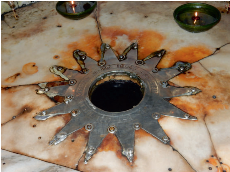
Foto: Die Geburtsstelle Jesu, Friedbert Simon in pfarrbriefservice.de

Möge das Licht der Weihnacht, Frieden in Ihre Familie tragen und Ihnen Zuversicht und Hoffnung schenken.